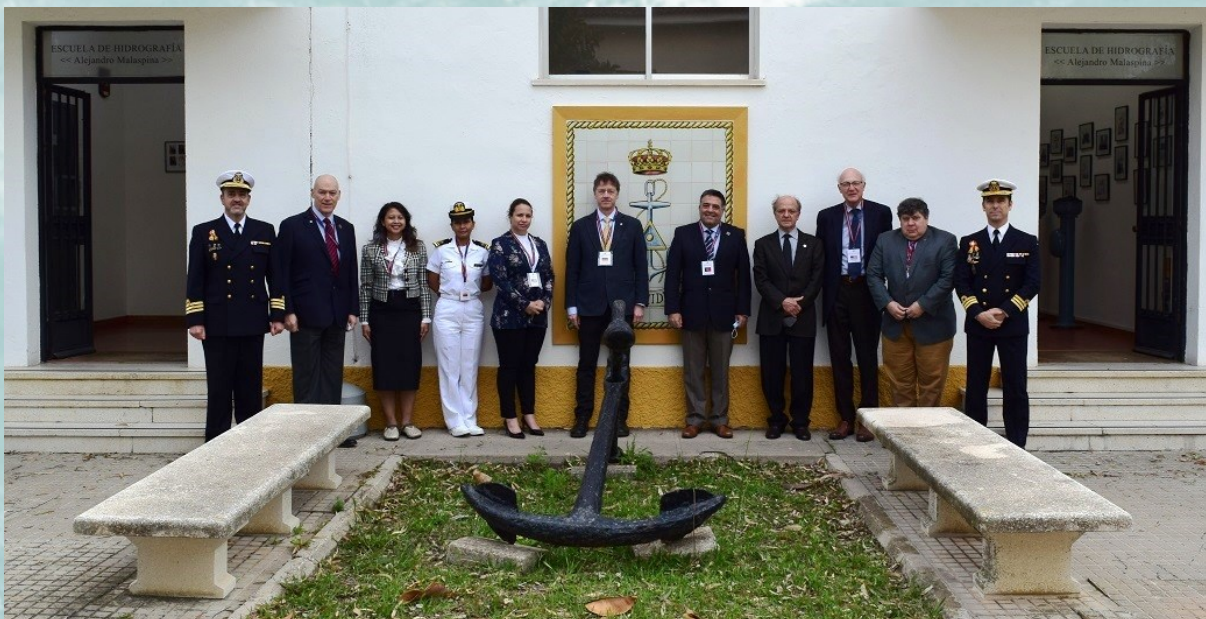
Les membres de l'IBSC avec le Vice-Directeur de l'IHM, le Directeur de l'école et les stagiaires du projet EWH à l'IBSC45.

Conformément au projet conjoint OHI-Canada intitulé Promouvoir le rôle des femmes dans le domaine de l'hydrographie (EWH), au cours de la première semaine de la réunion, trois stagiaires ont participé en personne à la réunion de l'IBSC45, dans le cadre du stage EWH-IBSC. Tous les stagiaires travaillent dans des instituts qui ont des programmes homologués par l'IBSC. Pendant le stage, ils ont bénéficié d'une formation sur le processus d'examen des soumissions et ont fait une présentation au Comité sur leurs résultats respectifs. Ils ont participé très activement aux débats du comité concernant les soumissions et ont apporté des contributions pertinentes qui ont démontré l'impact important de ce projet sur une éventuelle collaboration à la préparation d'une future soumission par leurs institutions respectives. Le Comité a apprécié la présence et la collaboration des stagiaires et les a invités à fournir également des commentaires sur les directives afin d'avoir un point de vue externe. Ils ont fait une présentation sur ce sujet, en soulignant plusieurs recommandations et commentaires. Après la réussite de ce projet, les membres ont indiqué qu'ils étaient intéressés par l'organisation d'autres stages lors des prochaines réunions.