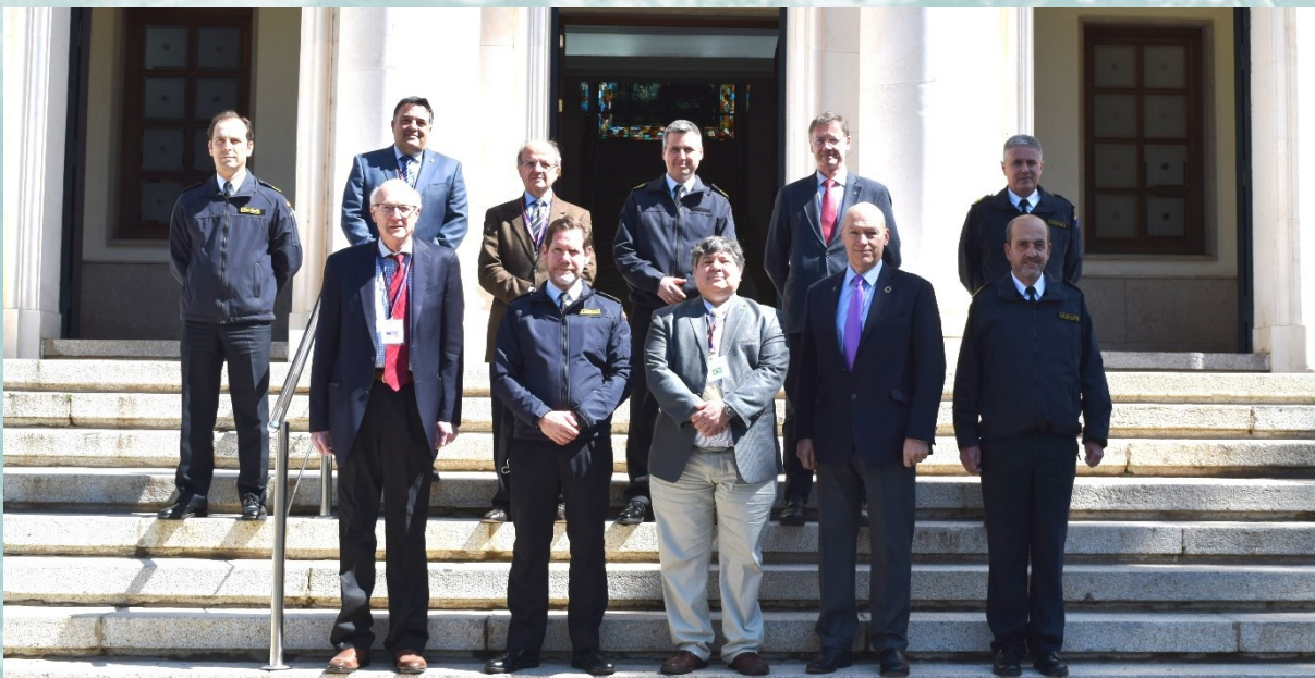
Les membres de l'IBSC présents à Cadix avec le Directeur de l'IHM et son équipe.

Au cours de la réunion, il a également été nécessaire de débattre et d'approuver d'autres items de travail importants tels que le programme de travail du Comité et d'établir une liste d'institutions prioritaires à visiter lorsque la situation le permettra. En raison de la nécessité d'augmenter le nombre de membres du Comité, l'IBSC proposera à l'IRCC une nouvelle version du mandat pour inclure deux membres supplémentaires de l'ACI.