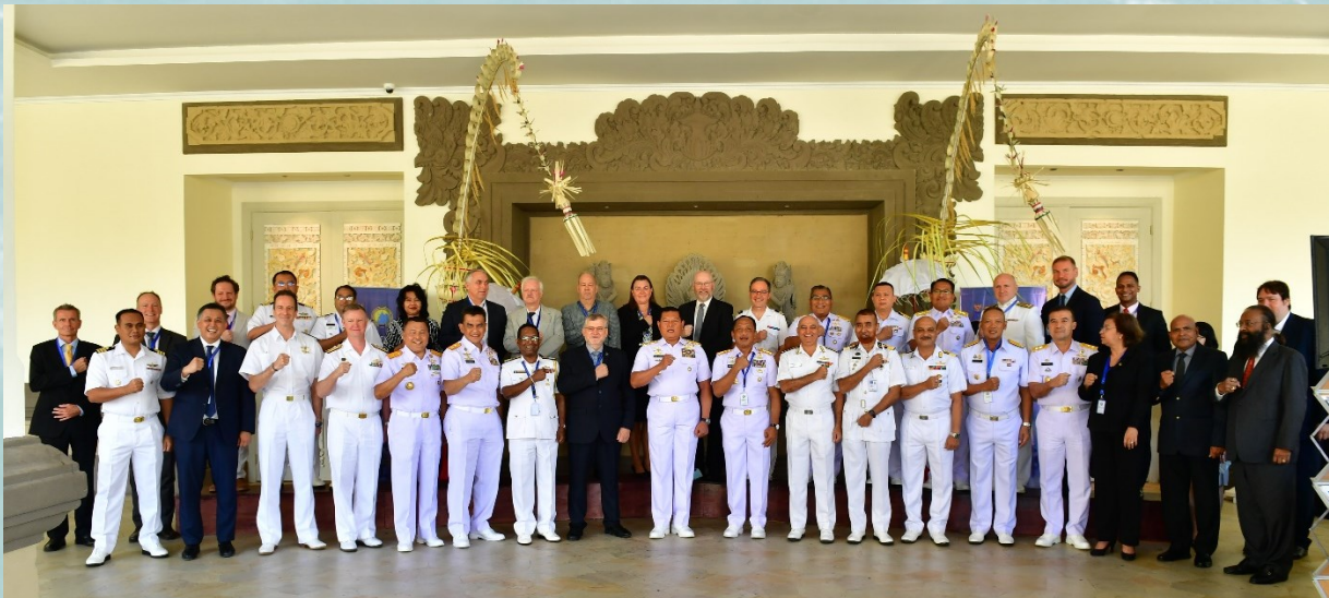
Participants à la conférence CHOIS21

La réunion a reçu un certain nombre de présentations de représentants de l'industrie. Ceux-ci ont mis en évidence les nouvelles technologies et les possibilités de formation offertes à la région. Les représentants de l'industrie ont tenu à souligner leur volonté de collaborer avec la CHOIS et ses membres pour aider au développement des capacités hydrographiques et cartographiques dans la région.