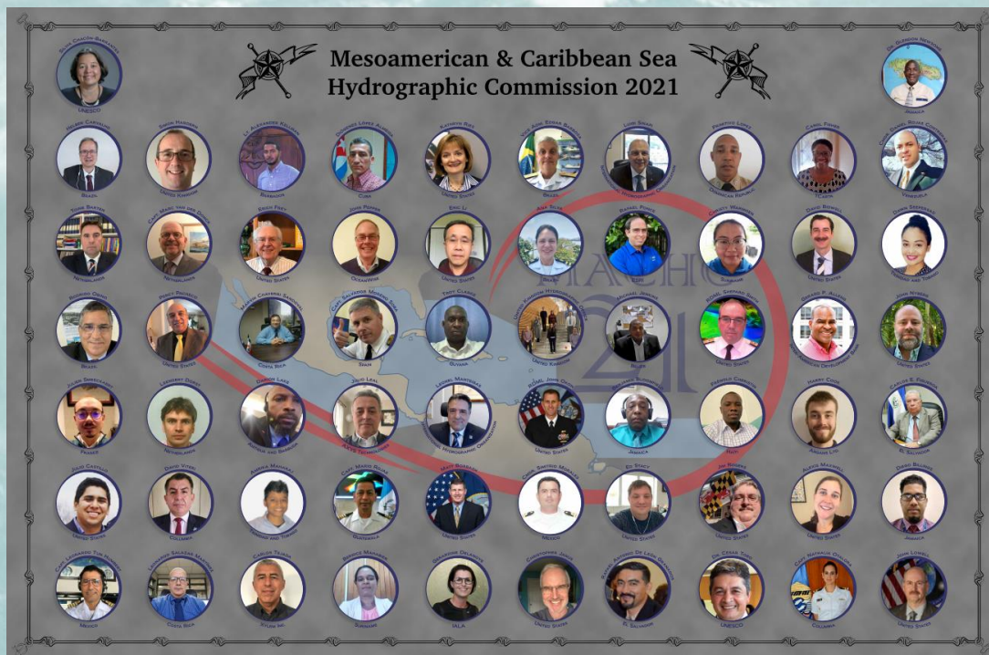
Quelques-uns des participants à la réunion CHMAC21

La 21 ème réunion de la Commission hydrographique de la Mésio -Amérique et de la mer des Caraïbes (CHMAC21), qui devait initialement se dérouler à la Nouvelle-Orléans (Etats-Unis), s'est tenue sous forme de VTC, en raison de la pandémie COVID-19, du 30 novembre au 3 décembre 2020.