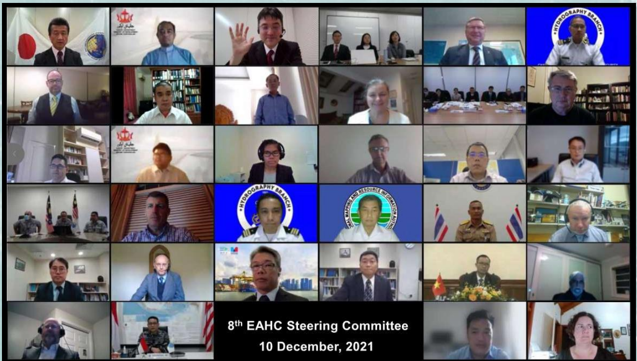
Une partie des participants à la réunion CHAO SC-8

Compte tenu de la poursuite de la pandémie de COVID-19, la prochaine réunion du CHAO SC se tiendra autour du Nouvel An lunaire de 2023 et la conférence de la CHAO aura lieu à l'automne 2022.