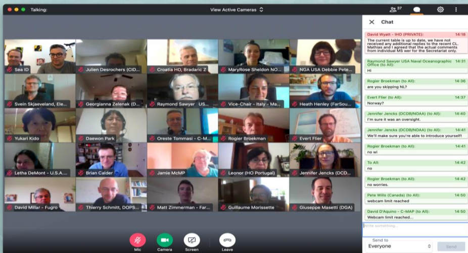
Quelques-uns des 43 participants connectés pour la réunion à distance du CSBWG9.