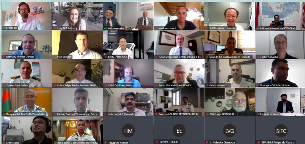
Quelques-uns des participants à la 19 ème réunion du CBSC