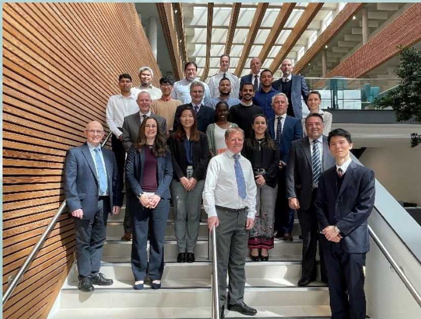
Les formateurs et les stagiaires du 12 ème cours GEOMAC avec l'équipe de l'OHI en visite.