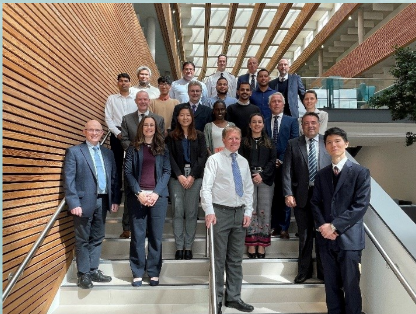
Les formateurs et les stagiaires du 12 ème cours GEOMAC avec l'équipe de l'OHI en visite.