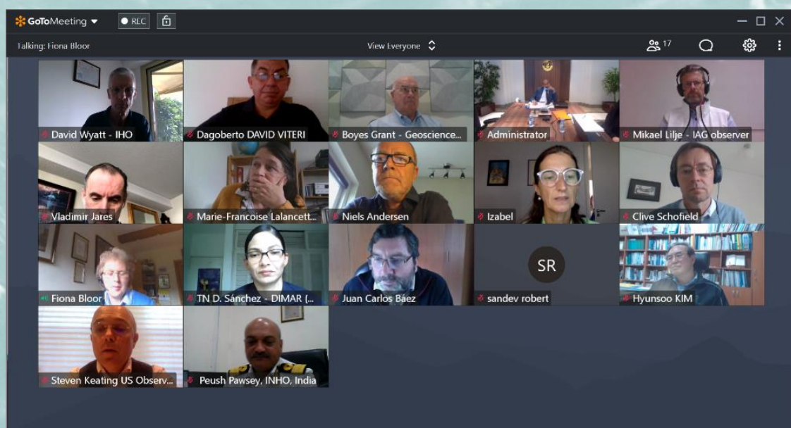
Les participants connectés à la réunion d'ABLOS BM27 à distance