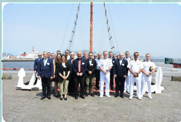
Discours de bienvenue et participants en personne à la NIPWG-9