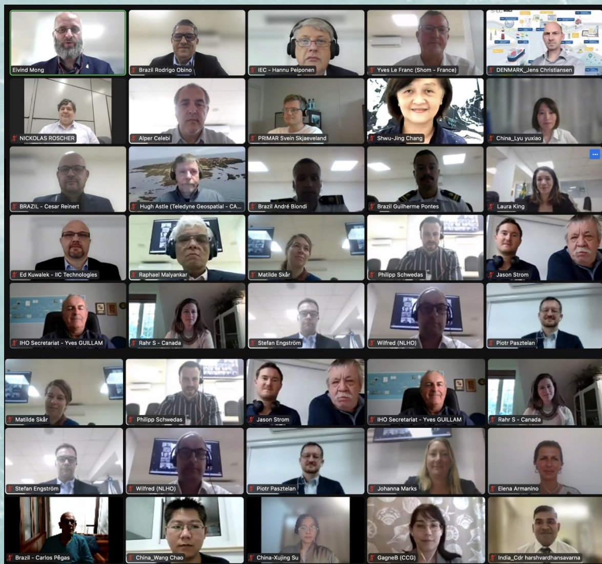
Certains des participants à la NIPWG-9 (en personne et en VTC)

Une réunion intersessions du NIPWG en VTC est prévue le 14 décembre, tandis que la 10 ème réunion du NIPWG est prévue du 12 au 15 septembre 2023, le lieu restant à déterminer.