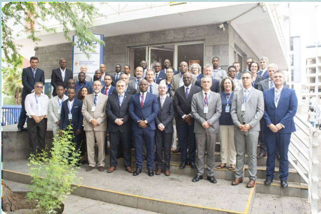
Participants en personne à la 17 ème conférence de la CHAtO