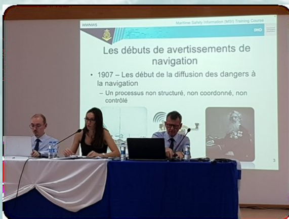
Le Coordinateur NAVAREA II (Shom, France) animant une session sur les avertissements de navigation

Le séminaire « Travailler avec le NAVAREA II et votre autorité cartographique principale » a été présidé par la France avec des contributions du Portugal et du Royaume-Uni. Tous les participants ont partagé leurs préoccupations et leurs expériences dans la gestion des renseignements sur la sécurité maritime, dans l'échange de données avec le coordinateur NAVAREA II (France) et / ou leur autorité cartographique principale (PCA). Le Secrétariat de l'OHI a réitéré une recommandation bien connue de la CHAtO sur la création d'un comité hydrographique national, car il est apparu que les Etats côtiers (comme le Togo) qui ont créé leur propre comité hydrographique national sont dans une bien meilleure situation pour s'acquitter de leurs obligations en matière de convention SOLAS.