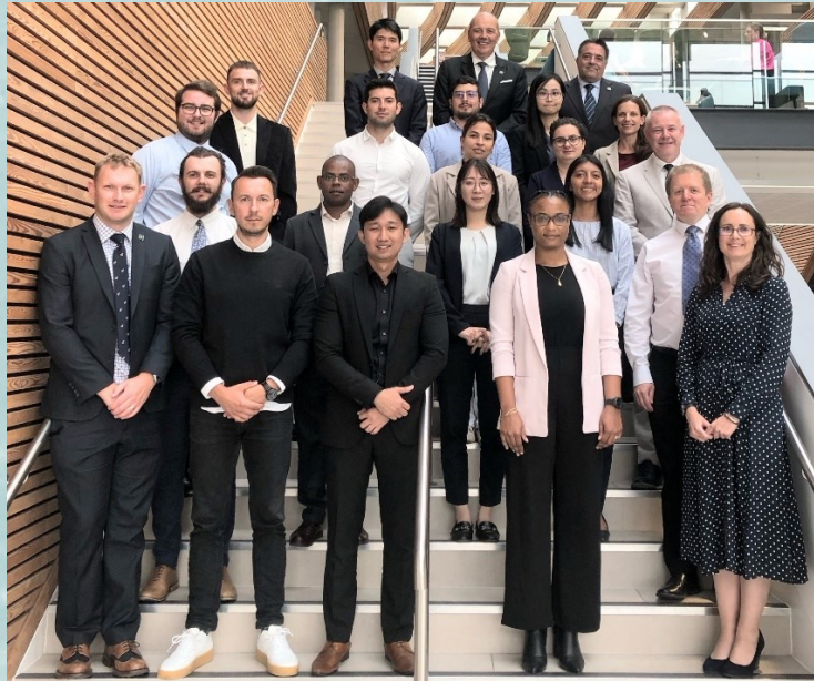
Les professeurs et les stagiaires du 15 ème cours GEOMAC avec la visite de l'équipe de l'OHI.