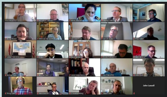
Los participantes de la 10. a reunión del GT WEND por VTC

En conclusión, a pesar de los desafíos y del Covid-19 en particular, el Presidente compartió su ambición de que el Grupo de Trabajo deberá hacer todo lo posible entre las sesiones para cumplir los plazos fijados por el Consejo, para que estuviese en condiciones de someter una propuesta sobre los Principios WEND100 en las próximas reuniones del IRCC y del Consejo, aunque algunas cuestiones pendientes debían examinarse aún más a fondo en una etapa posterior. En consecuencia, se decidió una lista de tareas y la reunión convino volver a reunirse en una segunda sesión VTC de la 10. a Reunión del GT WEND a fines de agosto, en cuanto se disponga de una versión más consensual y consolidada de los Principios WEND100.