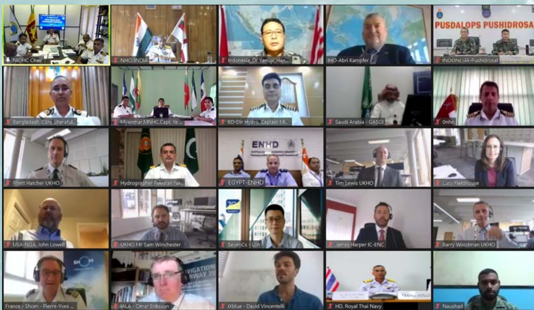
Algunos participantes de la 20.ª Conferencia de la CHOIS

Indonesia, actual Vice-Presidente de la CHOIS, asumirá la Presidencia de la CHOIS en los próximos cuatro meses, en conformidad con los Estatutos de la Comisión. No hubo candidaturas para el cargo de Vice-Presidente. El lugar y la fecha de la próxima reunión serán decididos en cuanto se sepa más con respecto a las opciones disponibles.