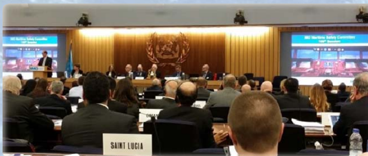
Le Secrétaire général de l'OMI, M. Kitack Lim, ouvre la session spéciale pour célébrer le MSC 100

Le Comité de la sécurité maritime (MSC) est l'organe technique le plus élevé de l'Organisation maritime internationale (OMI). Les fonctions du MSC consistent à examiner des questions relatives aux aides à la navigation, à la construction et à l'équipement des navires, aux règles sur la prévention des abordages, à la gestion des cargaisons dangereuses, aux procédures de sécurité maritime, aux informations hydrographiques, au sauvetage et au secours et à toute autre question affectant directement la sécurité maritime. La 100 ème session du MSC (MSC 100) a eu lieu au siège de l'OMI à Londres, Royaume-Uni, du 3 au 7 décembre 2018. L'adjoint aux Directeurs David Wyatt y a représenté l'OHI. En abordant l'ordre du jour de la session lors de son discours d'ouverture, le Secrétaire général de l'OMI, M. Kitack Lim, a mis en exergue les premiers avancements dans l'exercice de définition réglementaire sur les navires de surface autonomes, la nécessité d'approuver des directives révisées sur la fatigue ainsi que d'autres mises à jour des travaux sur des normes fondées sur des objectifs. Il a également attiré l'attention sur les travaux nécessaires en vue d'identifier des mesures de sécurité pour la navigation polaire non soumise à la Convention SOLAS ainsi que sur plusieurs questions de sécurité relatives aux carburants à faible teneur en soufre.