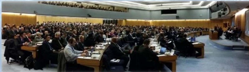
Le MSC 100 de l'OMI en session plénière

Le MSC a envisagé des mesures de sécurité pour les navires non visés par la Convention SOLAS navigant dans les eaux polaires. Le Comité a examiné la proposition visant à étendre la portée de l'application du Code polaire à certains navires non SOLAS. De manière générale, l'application obligatoire des chapitres 9, 10 et 11 du Code polaire n'a pas reçu de soutien ; toutefois, il a été convenu que des discussions plus poussées pour la révision du chapitre XIV de la Convention SOLAS pourraient avoir lieu lors de la