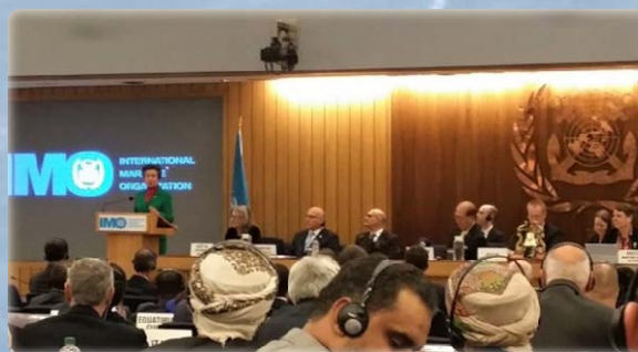
Son Altesse Royale la Princesse Royale prononce un discours lors d'une session du MSC 100

Au cours de ses discussions, le MSC a reçu la visite de Son Altesse Royale la Princesse Royale, qui a prononcé un discours devant le Comité et qui a écouté les réflexions de la plénière. Le MSC a reçu des rapports d'avancement du Pacte mondial pour des migrations sûres, ordonnées et régulières et du Pacte mondial de partage des responsabilités pour les réfugiés. Le MSC a reçu plusieurs comptes rendus d'Etats