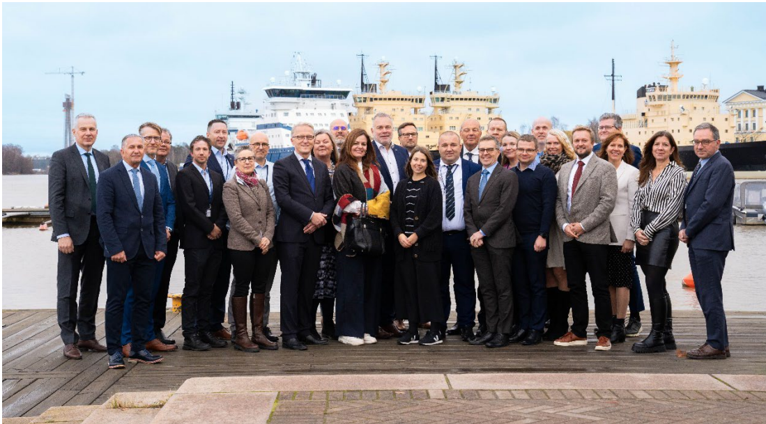
Participants à la PAC31 – 12-14 novembre, Helsinki, Finlande