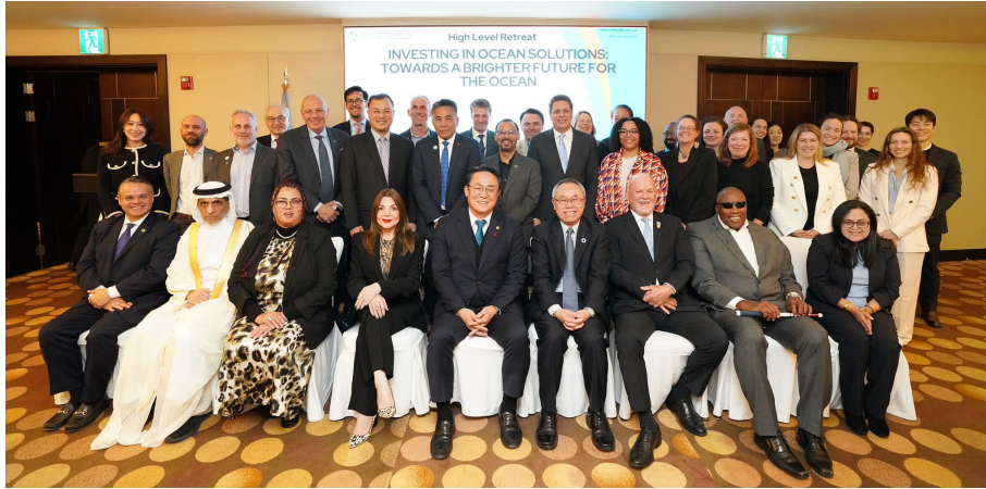
Participants au séminaire de haut niveau - 14-15 janvier 2025 - Incheon, République de Corée