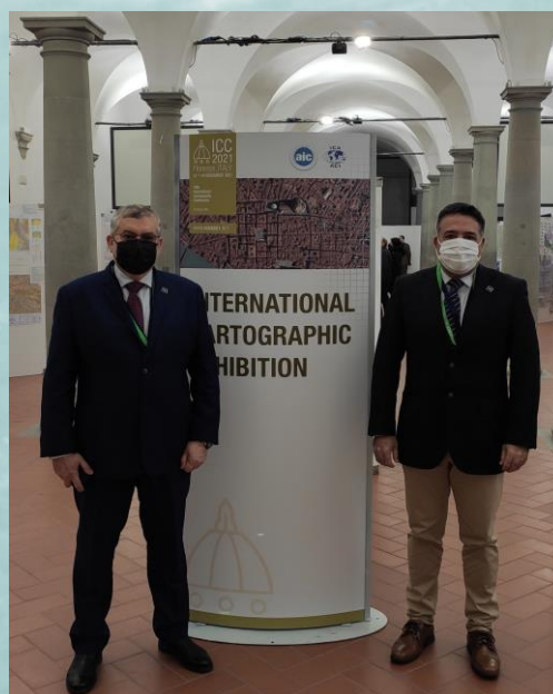
La délégation de l'OHI à l'exposition cartographique.

L'ICC 2021 a consisté en une Conférence, lors de laquelle de nombreux articles scientifiques sur des sujets liés à la cartographie ont été présentés tout au long de la semaine dans le cadre de sessions parallèles, et en une Exposition cartographique, où différentes cartes et autres produits cartographiques des pays membres de l'ACI ont été présentés avec plusieurs exemples de cartes marines. Les documents de l'exposition cartographique présentés dans l'exposition virtuelle et ceux exposés sur place peuvent être consultés à l'adresse suivante : http://www.geografia-applicata.it/icc-2021-virtual-exhibition/