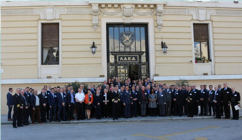
Les participants à l'atelier de l'OTAN sur l'utilisation des normes civiles