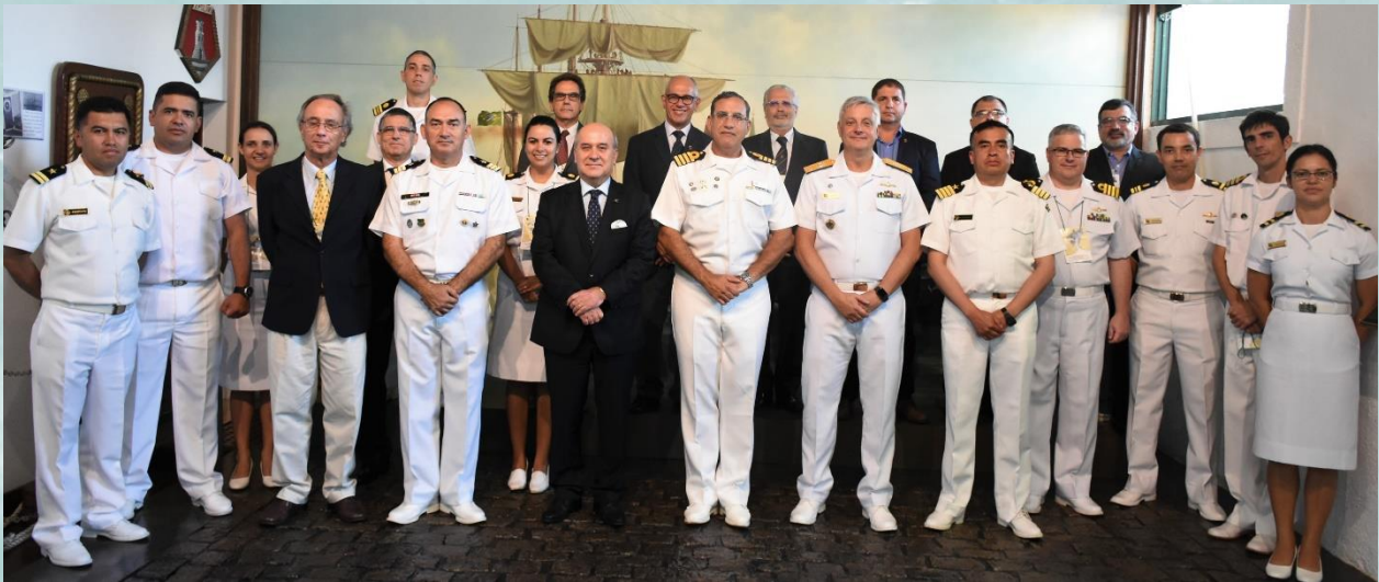
Les participants à la réunion CHAtSO14.

La prochaine conférence de la CHAtSO aura lieu en mars 2021 à Montevideo, Uruguay, la date exacte restant à confirmer.