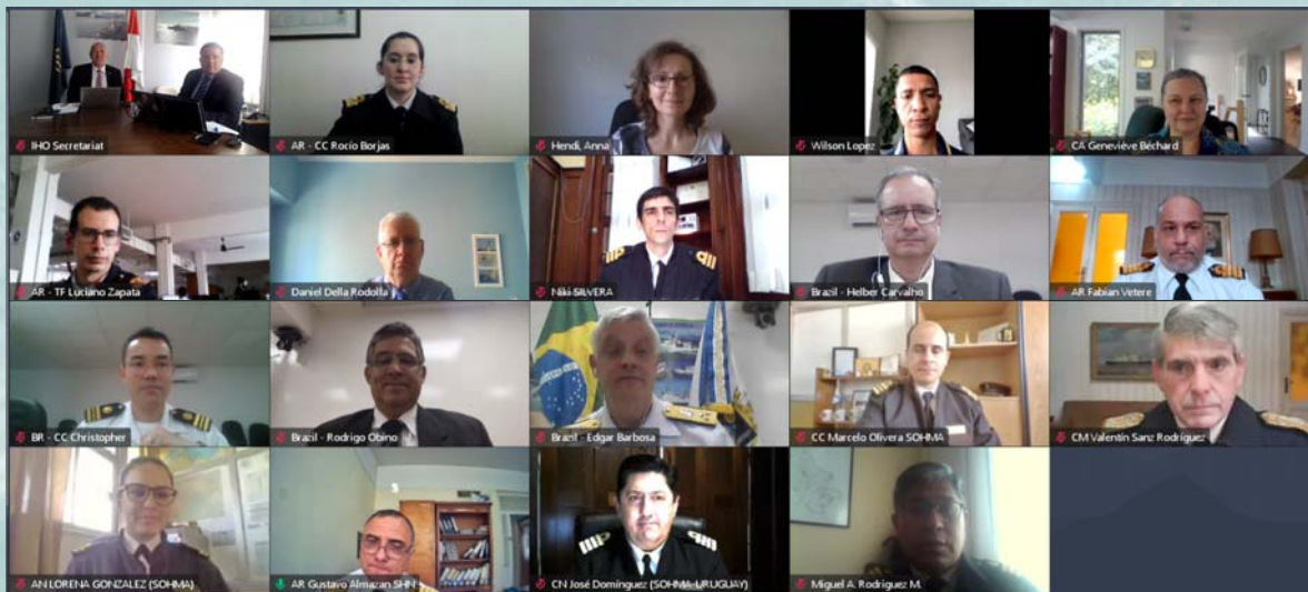
Les participants à la réunion CHAtSO15.

aux recommandations de la résolution 2/1997 de l'OHI telle qu'amendée par l'A-2. Il a également donné un aperçu du programme de renforcement des capacités de l'OHI, des services de renseignements sur la sécurité maritime, de la bathymétrie participative, de la GEBCO et du projet Seabed2030, des SIG et de la base de données de l'OHI et, enfin, de la promotion de l'OHI, en soulignant les célébrations du centenaire de l'OHI et le lancement récent du nouveau site web de la Revue hydrographique internationale (RHI).