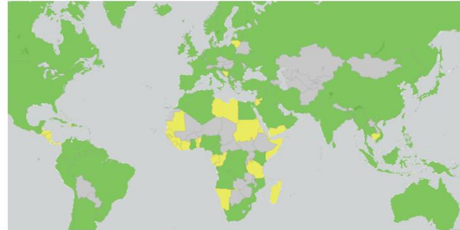
Appartenance à l'OHI dans le Monde