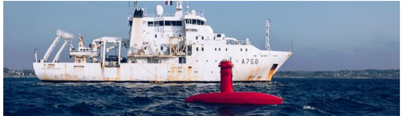
Essais de l'USV DRiX déployé à partir du BHO Beautemps-Beaupré DRiX trials from SV Beautemps-Beaupré