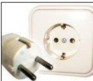
Tipo F: Esta toma también funciona con la clavija C y E