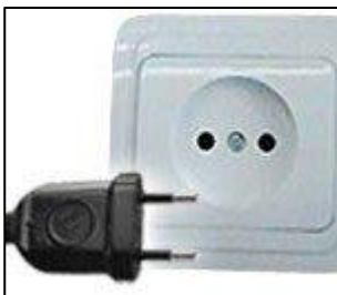
Tipo C: Esta toma también funciona con la clavija E y F