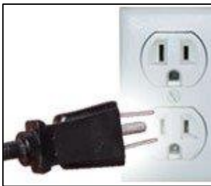
Tipo B: Esta toma también funciona con la clavija A