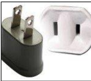
Tipo A: Esta toma no tiene clavijas alternativas

En Surinam, las tomas de corriente son de tipo A, B, C y F.