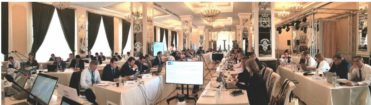
Participantes en sesión de la 24ª Conferencia de la CHMMN – Figura 1

La Conferencia vino precedida el 1 de julio, por sucesivas sesiones de trabajo dirigidas por los Presidentes de los Grupos de Trabajo de la CHMMN, con el objetivo de finalizar las recomendaciones y acciones propuestas que se presentarían a la Conferencia plenaria para decisión, si era apropiado.