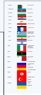
Estado de las estaciones NAVTEX en la NAVAREA III – Figura 2

También surgieron problemas contenciosos sobre la cobertura NAVTEX en el Mar Egeo, lo que generó declaraciones adicionales de Grecia y Türkiye, y Chipre.